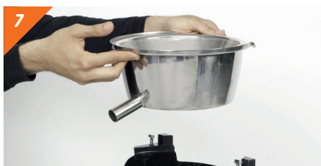
Désassembler le réservoir et le filtre en acier inoxydable en tirant vers le haut, verticalement.