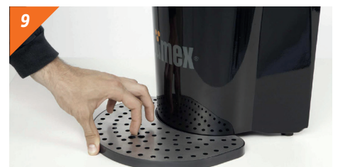
Démonter la plateau repose-verre en introduisant le doigt dans un des trous centraux de l'élément en acier et en tirant vers le haut.