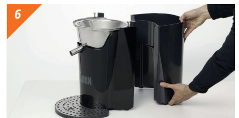
Démonter le bac à résidu en tirant vers soi horizontalement.