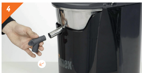
Démonter le robinet en tirant vers soi.