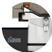
Speed S +plus