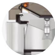
Speed S +plus All-in-One