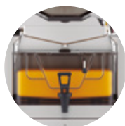
Speed S +plus Tank All-in-One